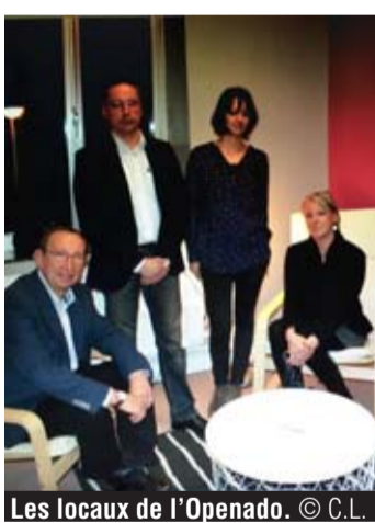
Les locaux de l'Openado.

Ce dispositif attache une grande importance à l'insertion socio-professionnelle mais également, à l'accès à un logement décent, à la santé et traitement des assuétudes et aux liens sociaux, intergénérationnels et culturels. Le PCS travaille d'ailleurs dans ce sens. Comment ? Notamment en développant différentes ini-