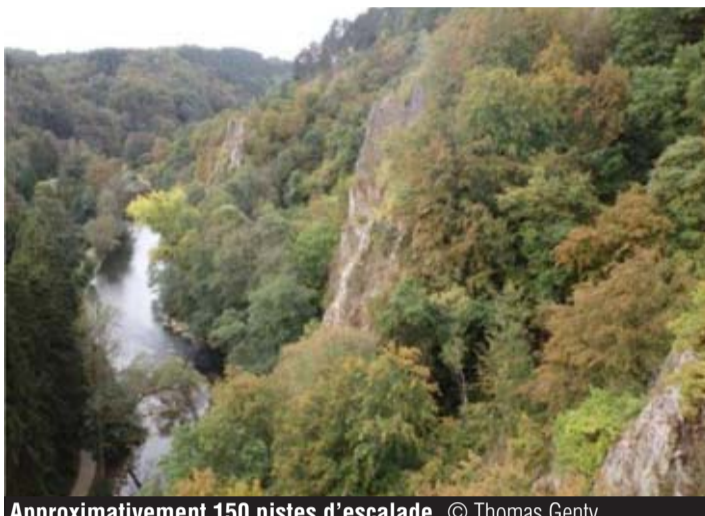
Approximativement 150 pistes d'escalade.

Les travaux prévus pour la réfection du pont de la rue de Lognoul vont pouvoir commencer, pour un budget total de 82.073 euros, sur fonds propres. « La rue est fermée depuis fin 2015 aux véhicules de plus de 3,5T, ce qui oblige les bus à faire un détour. Il faut savoir que c'est un axe fort