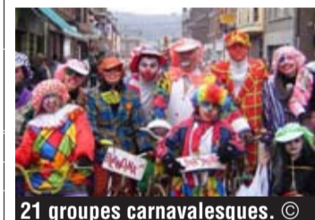
21 groupes carnavalesques.