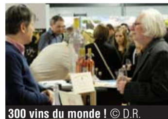
300 vins du monde !

Ce vendredi 24, samedi 25 et dimanche 26 février a lieu la 11 e édition du salon du vin et de la gastronomie au hall omnisports de Huy. L'organisation vous propose une sélection de plus de 300 vins du monde, « des vins de Géorgie, d'Afrique du Sud, Moldavie etc. » et 14 nouveaux expositions. Un événement qui draine entre 3200 et 3600 personnes ! Action de promotion lors du salon, à l'achat de 12 bouteilles, recevez une gratuite. « Vous recevez un catalogue avec la liste des exposants qui participent à l'action. » Restauration, brasserie également présentes. Aide au transport de vos achats jusqu'à votre véhicule. Intéressé ? Rendez-vous ce samedi et dimanche dès 11h, avenue de la Croix Rouge, 4 à Huy. Comptez 8 euros par entrée par personne. Entrée gratuite pour les enfants de moins de 12 ans. ●