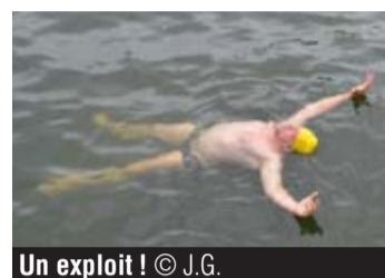
Un exploit !

La traversée hivernale de la Meuse risque fort d'être mémorable cette année. Et pour cause, l'organisation fête la 50 e édition de ce mythique plongeon. Ce dimanche 26 février, ne soyez donc pas surpris de voir des centaines de personnes attroupées au quai d'Arona vêtues de maillots et bonnets. Vous souhaitez faire partie de ces nombreux courageux ? C'est l'occasion ou jamais de fêter